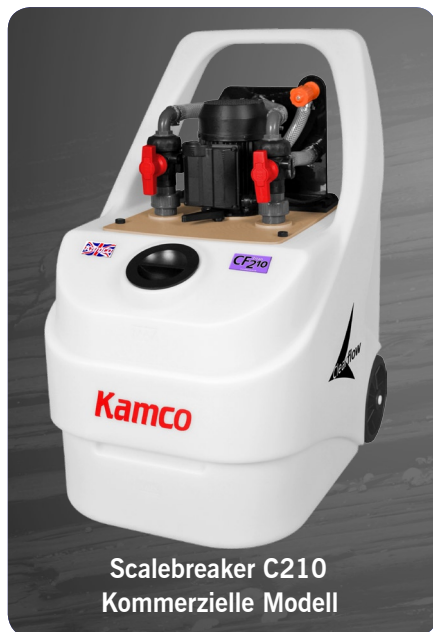
Scalebreaker C210 Kommerzielle Modell