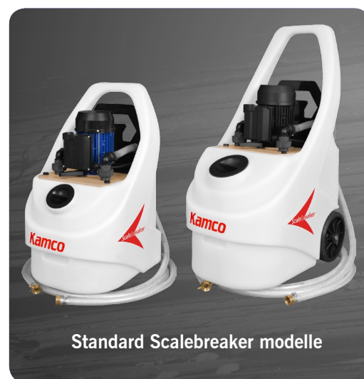
Standard Scalebreaker modelle

Schläuche: verstärktes, transparentes PVC.