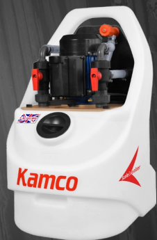
Scalebreaker C40 mit Wahlfrei Frischwasser- spülung Anlage