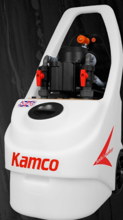
Scalebreaker C90 mit Wahlfrei Frischwasser- spülung Anlage