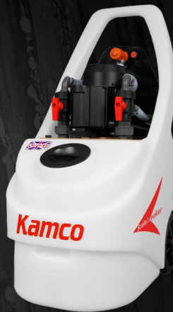
Scalebreaker C90 avec l'installation de rinçage optionnelle