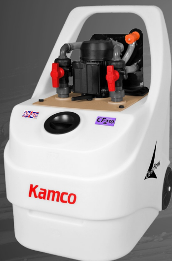
Scalebreaker C210 avec l'installation de rinçage optionnelle