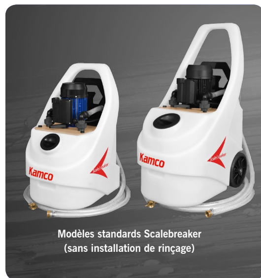
Modèles standards Scalebreaker (sans installation de rinçage)