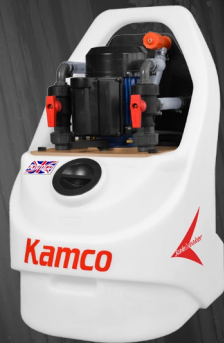
Scalebreaker C40 avec l'installation de rinçage optionnelle