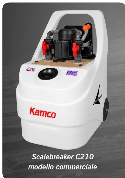
Scalebreaker C210 modello commerciale

• Macchinari plastici – raffreddatori dell'olio, stampi, cilindri d'estrusione e tubazioni.