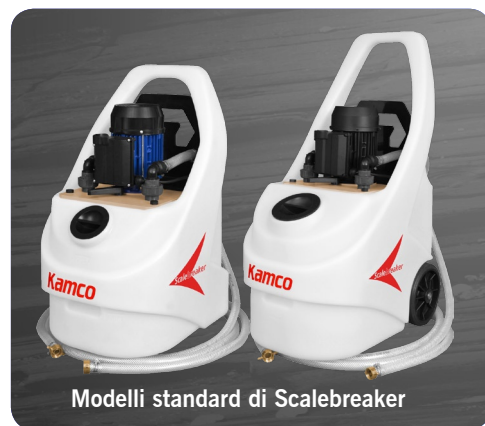
Modelli standard di Scalebreaker